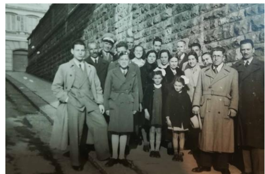
I membri della chiesa evangelica di TS al termine del culto di adorazione, maggio 1942.

Quella di Trieste, per la sua collocazione geografica, e quindi Il Faro in particolare, sta ridiventando una chiesa cristiana evangelica multi-etnica come lo era già stata nella prima metà del secolo scorso.