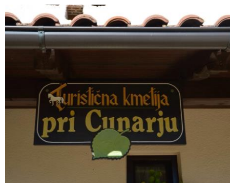
Foto dalla gita dei giovani a Jursce in Slovenia